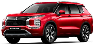
Rdeča Diamond (P62)