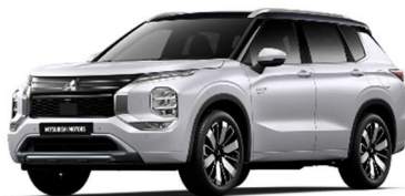
Bela Diamond / črna streha (XW4*)