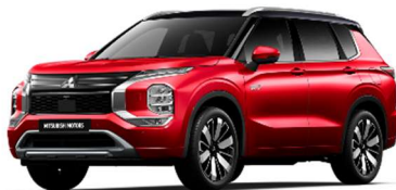
Rdeča Diamond / črna streha (XP2*)