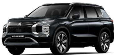
Črna Diamond (X47)

Dvobarvne karoserije samo za Instyle in Instyle +