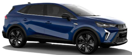
Modra Royal kovinska (RQH)