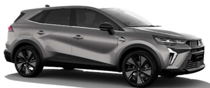
Siva Steel kovinska (KNG)