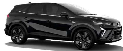
Črna Onyx kovinska (GNE)