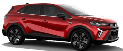
Rdeča Sunrise biserna (NNP)