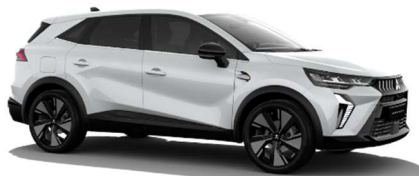
Bela Crystal biserna (QNC)