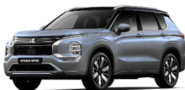
Siva Moonstone / črna streha (XGU*)