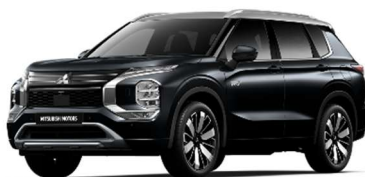
Črna Diamond / srebrna streha (U2X*)