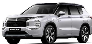
Bela Diamond / črna streha (XW4*)