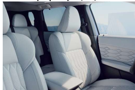
Svetlo sivo usnje s prešitjem (24H) – INSTYLE