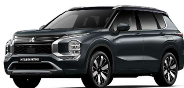
Siva Graphite / črna streha (XFU*)

Dvobarvne karoserije samo za Instyle in Instyle +