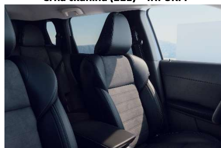
Črna alkantara / usnje (22J,23J) – INVITE in INTENSE