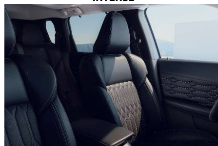
Črno usnje s prešitjem (24L) – INSTYLE