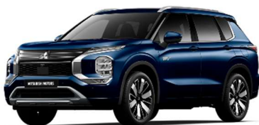
Modra Cosmic (D14)