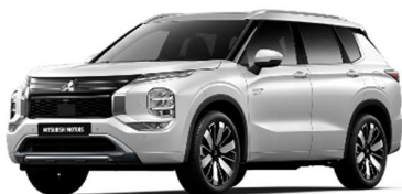
Bela Solid (W37)