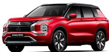
Rdeča Diamond / črna streha (XP2*)