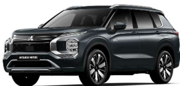
Siva Graphite (U28)