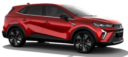
Rdeča Sunrise biserna (NNP)