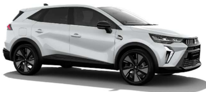
Bela Crystal biserna (QNC)