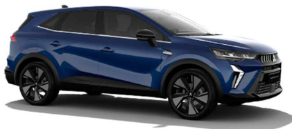
Modra Royal kovinska (RQH)