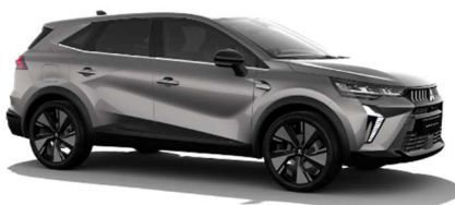
Siva Steel kovinska (KNG)