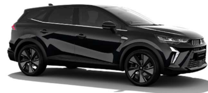
Črna Onyx kovinska (GNE)