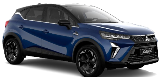
Modra Royal kovinska (RQH, YNM*)