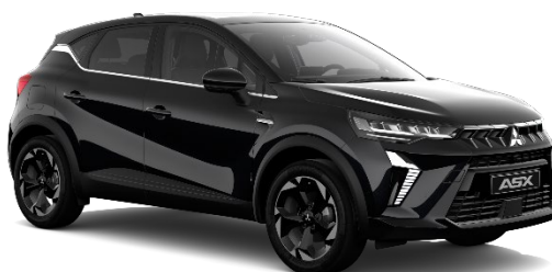
Črna Onyx kovinska (GNE)

*Dvobarvna karoserija s črno streho opcijsko.