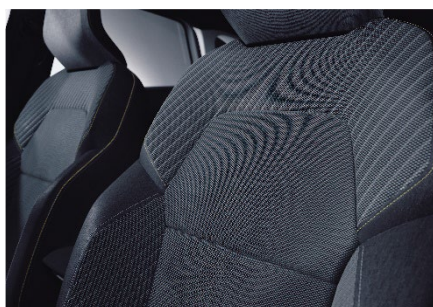
Črna tkanina – za INTENSE