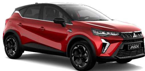
Rdeča Sunrise biserna (NNP, XPA*)