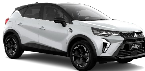
Bela Crystal biserna (QNC, XUI*)