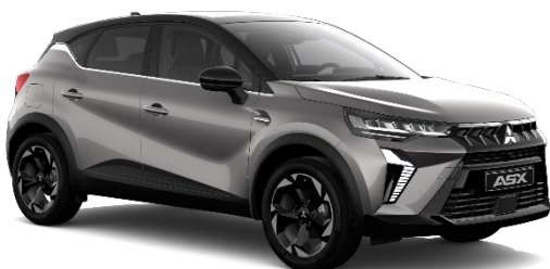
Siva Steel kovinska (KNG, XNK*)